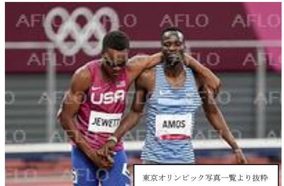
東京オリンピック写真一覧より抜粋