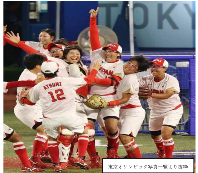
東京オリンピック写真一覧より抜粋

しょうか、これは選手の皆さんが、この日のためにどれだけ努力・苦勞をしてきたかと言うことがお互いにわかるから、相手をたたえることができるのだらうと思います。自分のことだけを考えるのではなく相手を思いやる心、生徒の皆さんにもこのような心が持てる人になってほしいと思います。